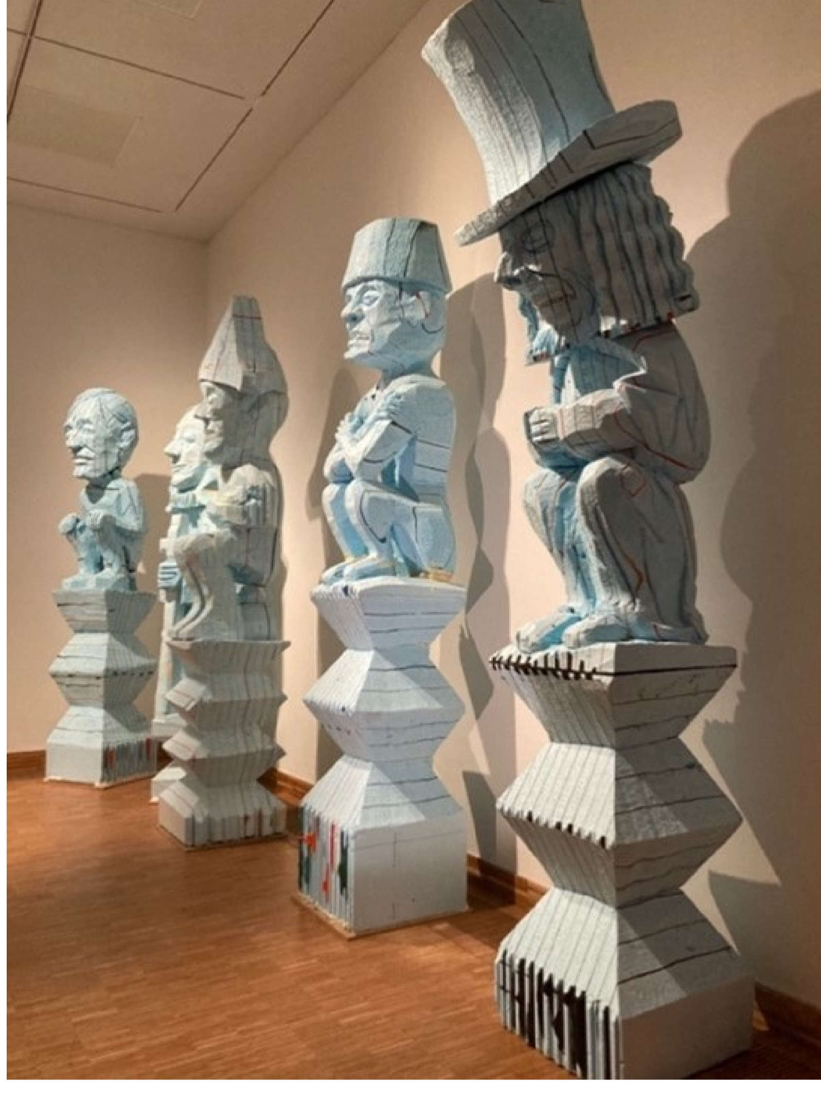
Installatie van historische iconen van Folkert de Jong in Kunsthal KAdE, Amersfoort

Later is ook een bezoek aan de gieterij gepland. Hiervan is de datum nog niet bekend.