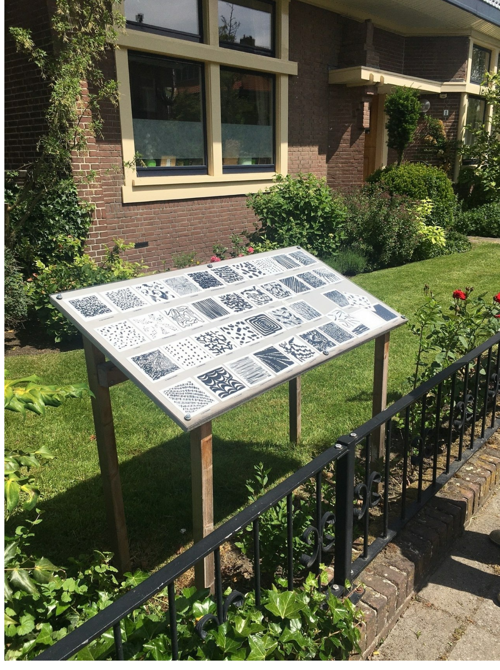
Julia van Duijn, 39 karakters en 1 QR-code in de tuin van Oranjelaan 1, Oegstgeest