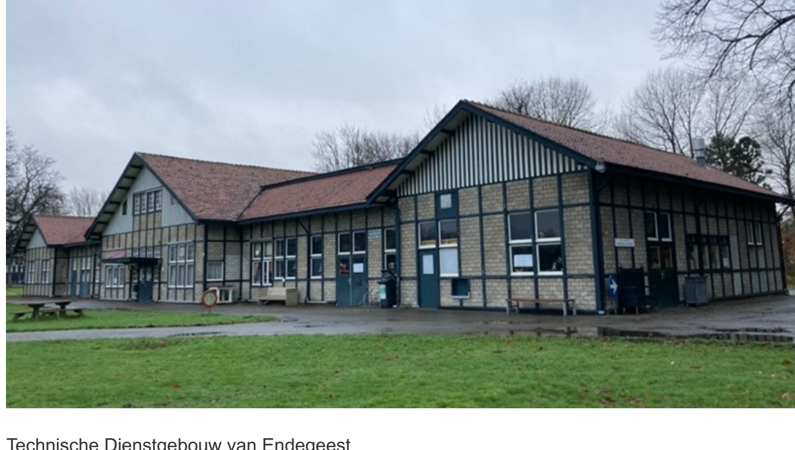
Technische Dienstgebouw van Endegeest